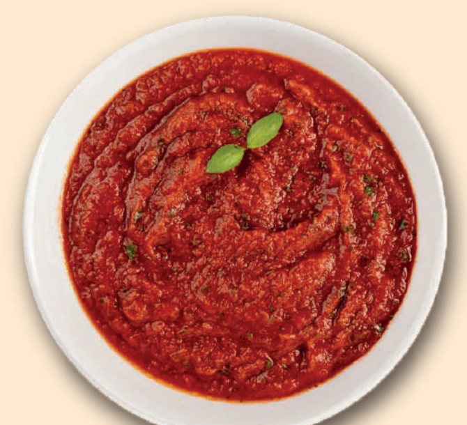
À LA NAPOLITAINE