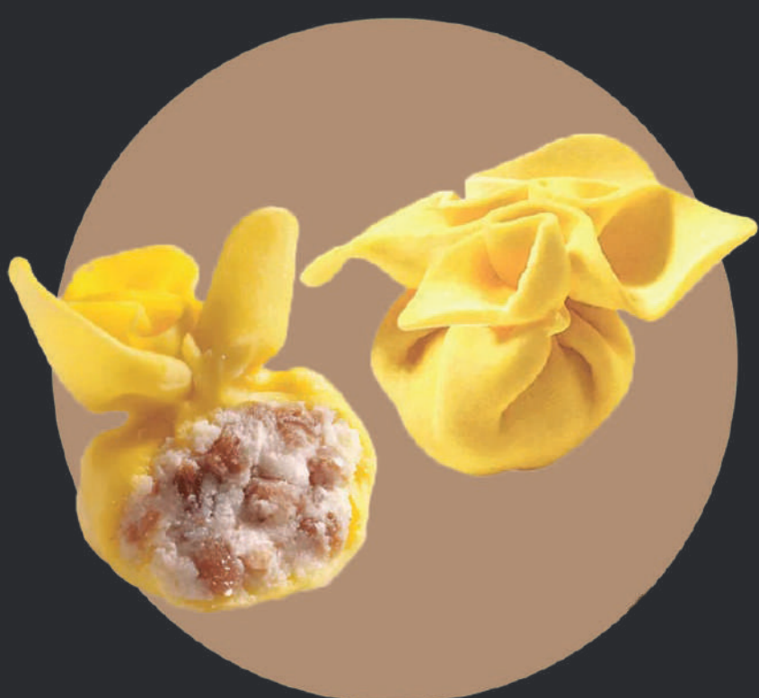
FIOCCHI SPECK & FROMAGE