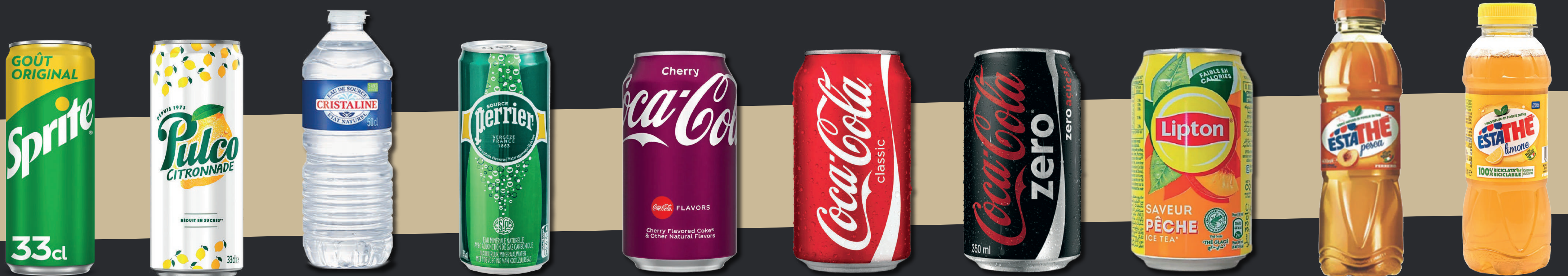
SPRITE PULCO CITRON EAU PLATE EAU PÉTILLANTE COCA CHERRY COCA CLASSIC COCA ZERO ICE TEA PÊCHE ESTATHÉ PÊCHE ESTATHÉ CITRON