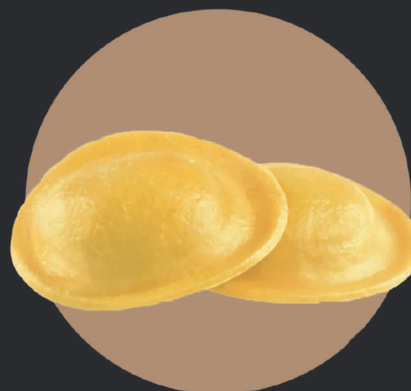
LUNETTES À LA TRUFFE