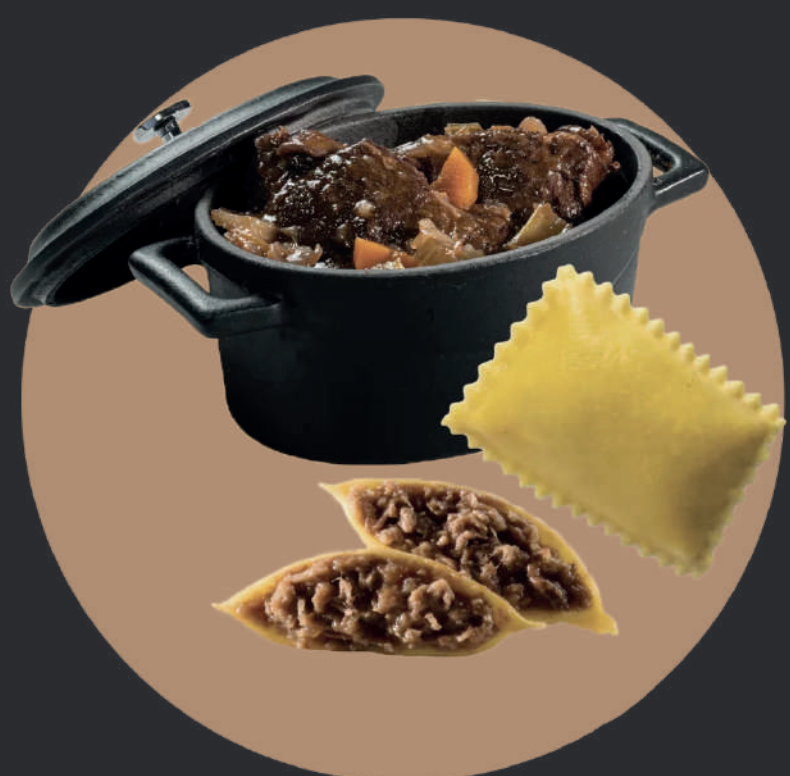
BAULETTI BOEUF BRAISÉ & BAROLO