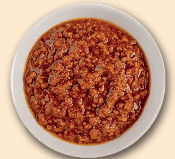
À LA BOLOGNAISE